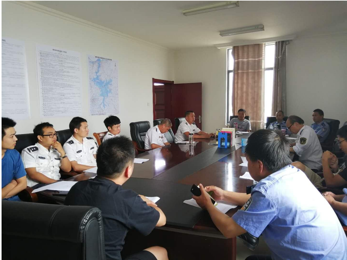
组织执法人员学习鄱阳湖区联合巡逻执法工作规范 及联谊联防工作规范

都昌水政监察大队，水上公安联合执法，并派出 13 名执法人员，将停留西源塘口水域的 4 艘钻井泵，主机，钢缆进行切割。