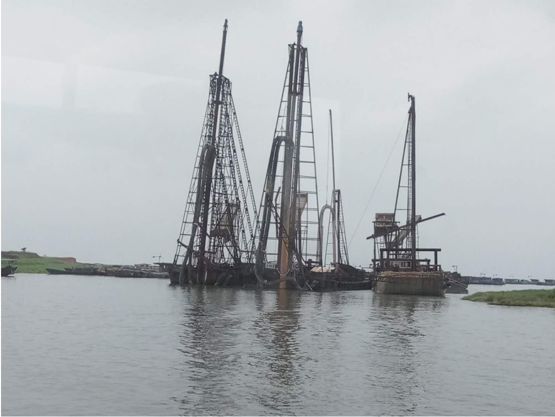
鄱阳县采砂船只集中停放点

今日 8 时 30 分，省市联合巡逻组乘赣海巡 426 由蛇山岛执法点出发，前往龙口附近水域进行巡查。重点查看湖区采砂船、渔船日常管理，同时查看了鄱阳县采砂船集中停放点，以及采砂船只监管情况。